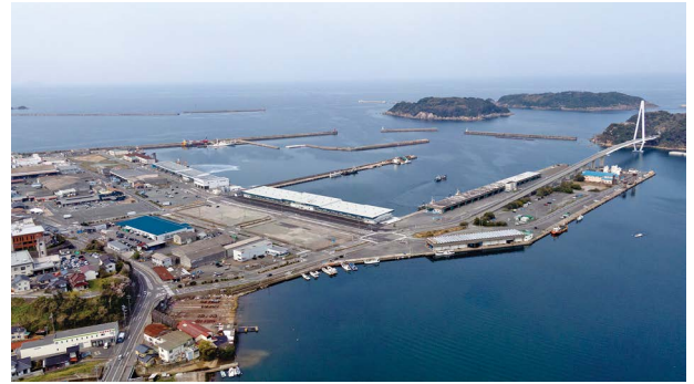
「浜田漁港」

また、出荷流通についても殺菌冷海水を使用した高鮮度処理による「しまね定置もん」、拠点漁港である浜田漁港で水揚げされるアジは脂質が10%を超えたものを「どんちっちアジ」とするなど、ブランド化に向けた様々な取り組みがなされています。